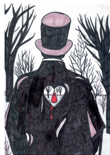
Иллюстрация к произведению «Евгений Онегин».